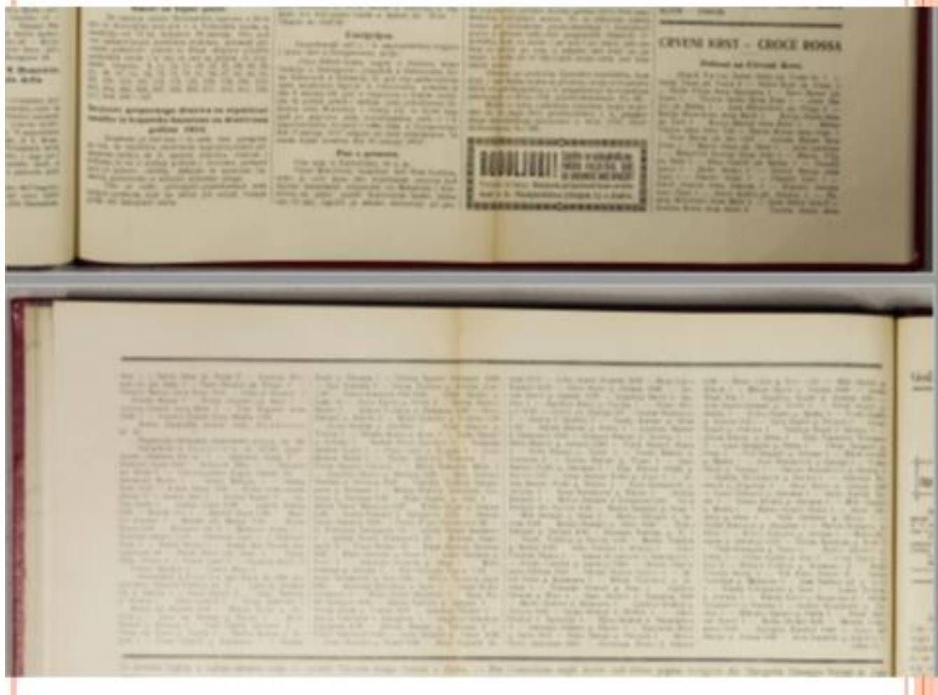
Слика 2: Текст о добровољним даваоцима организацији Црвеног крста